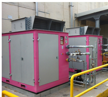
Optimisation énergétique hôtel par trigénération