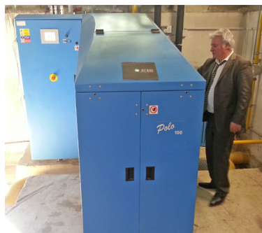
Optimisation déshumidification piscine municipale par PAC moteur gaz

L' objectif de l'étude d'optimisation énergétique , est de vous permettre, à partir d'un bilan plus approfondi de vos unités de production, de définir concrètement vos travaux d'optimisation et d'estimer les économies que vous pouvez en attendre.