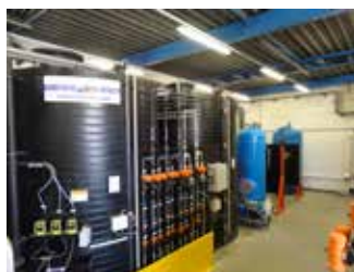
Vue des deux lignes de recyclage