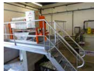
Vue partielle du traitement des éluats

Association régie par les articles 21 et 79 II du code civil local